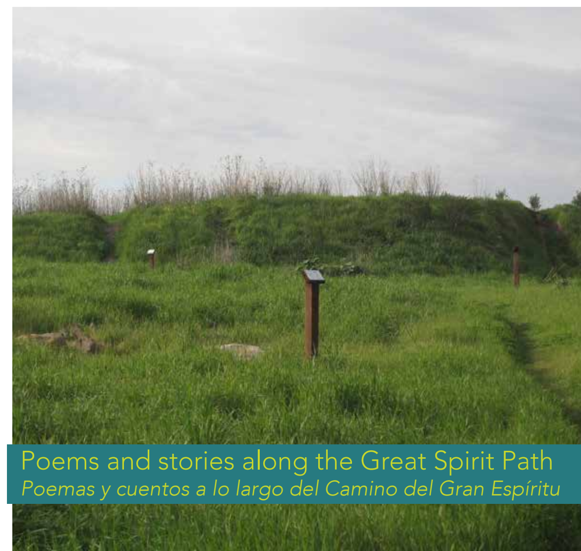
Poems and stories along the Great Spirit Path Poemas y cuentos a lo largo del Camino del Gran Espíritu