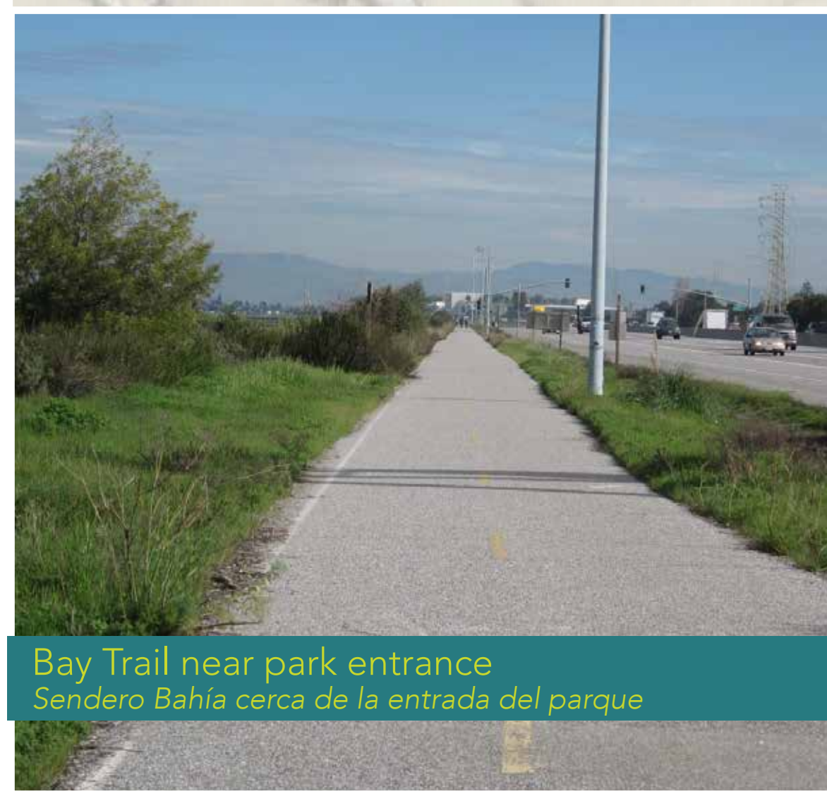
Bay Trail near park entrance Sendero Bahía cerca de la entrada del parque

Wayfinding signage is lacking. No information for mileage distance, routes, ADA access. Faltan letreros de orientación. No hay información sobre las distancias, rutas o acceso para discapacitados